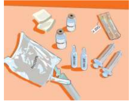
4.2 Vaihe 1: Tarvikkeiden valmistelu