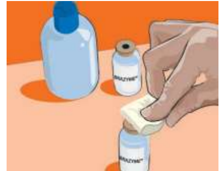
4.3 Vaihe 2: Desinfioi injektio-pullo