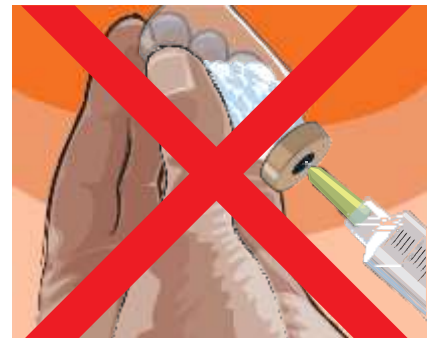
4.4 Vaihe 5: Käyttövalmiissa injektioliuksessa ei saa olla vaahtoa