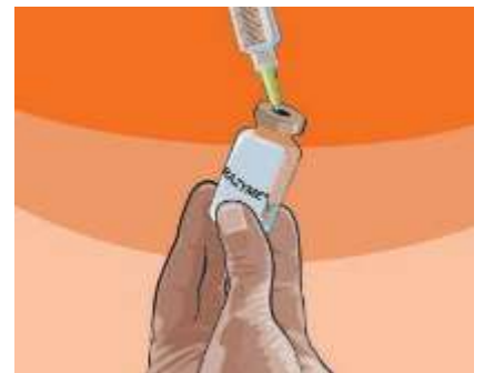
4.3 Vaihe 5: Vältä injektio-nesteisiin käytettävän veden voimakasta ruiskuttamista