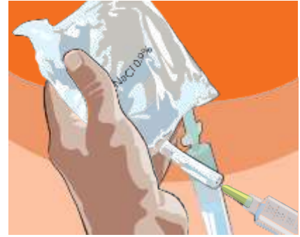
4.4 Vaihe 3: Ota pussista hitaasti 0,9-prosenttista NaCl-liuosta sama määrä, joka vastaa käyttövalmiin Fabrazyme-injektiolioksen määrää