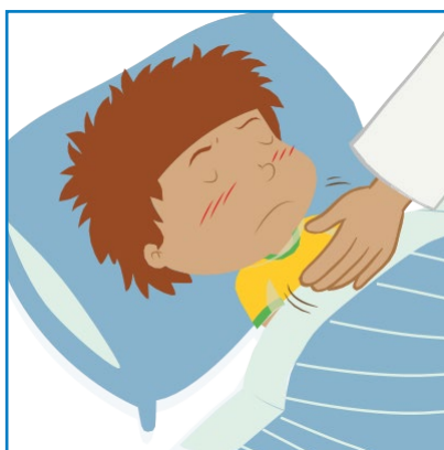
Trötthet, svårt att vakna