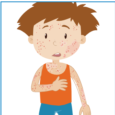
kalpea, laikukas iho, ihottuma